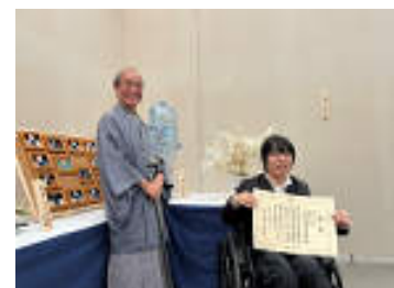
とっておきの芸術祭 授賞式