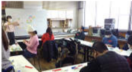
【パステルアート講習会の1コマ】

感染防止の観点から本年度も休止とした講座もありましたが、単発講座として「パステルアート講習会」、「笑いヨガ講習会」、「フラダンス講習会」などを実施し、地域住民の方も幅広く参加してもらい、障がいのある方と交流する良い機会となりました。