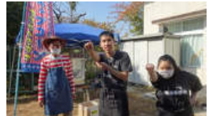
洛南まつり ポップコーン販売

2023年度も「とっておきの芸術祭」に作品を出展しました。2023年度はグループで出した作品が「京都市長賞」を受賞することが出来ました。創作活動を含む分室活動も好評を得ており利用者の方のモチベーションアップに繋がっています。