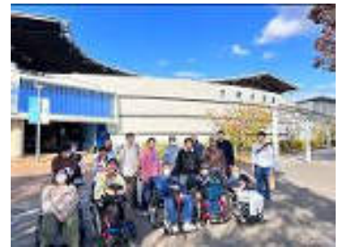
<日帰りレクの様子>

今年度は1名が一般就労に結び付いた。授産所でも行っていた清掃作業を含む業務内容であり、6か月以上継続して就労出来ている。利用者同士で社会人としてのマナーや基礎知識を教え合う場を設ける等就労意欲の向上に繋げた。過去に授産所から一般就労した方について、適宜相談に応じた。OB会については、今年度も新型コロナウイルスの影響を受け中止した。