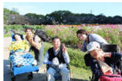
〔外出行事「ピクニック」〕

また、当施設ではデイ利用者および家族の高齢化が進んでおり、家庭生活から一人暮らしやグループホームなどに移行された方への支援にも継続して取り組んだ。入居先や居宅事業所等との連携を図り、これからも住み慣れた地域で安心して暮らせるよう様々な形で尽力している。